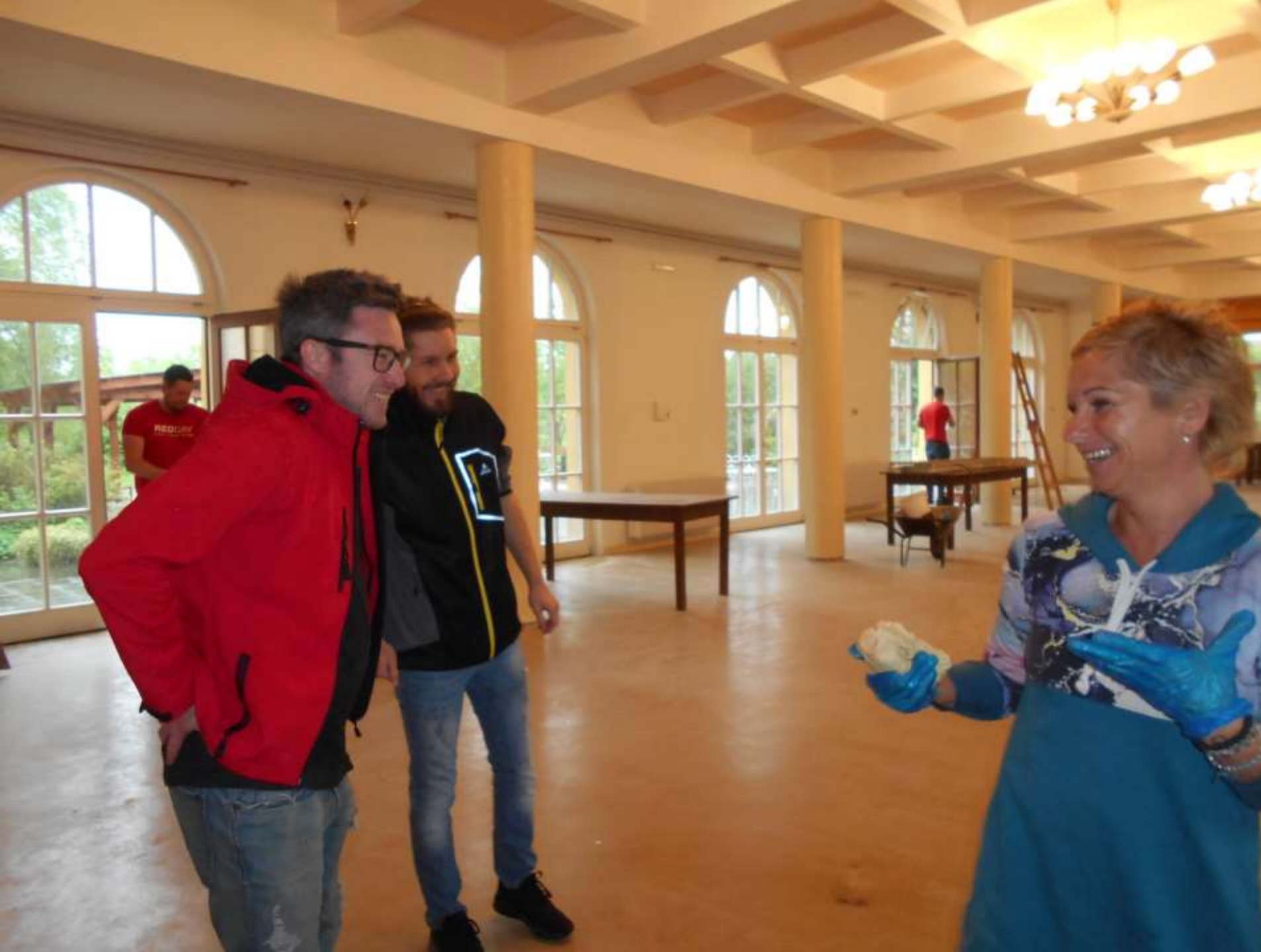
Myslibořice, Dinning hall